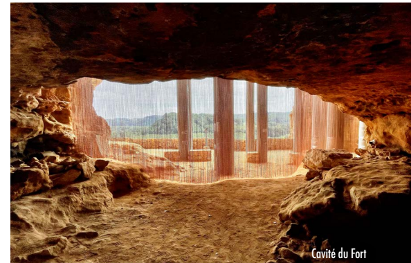
Cavité du Fort

Dans la grotte de l'ancien refuge fortifié, l'histoire de la Roque-Gageac prend vie ! Depuis les rives de la Dordogne, jusqu'au nid d'aigle surplombant le château de l'Évêque aujourd'hui disparu, un film de reconstitution 3D vous propose de remonter le temps.