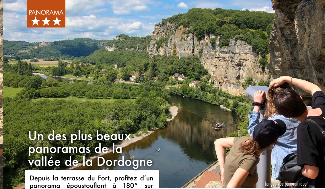
Longue vue panoramique