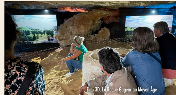
Film 3D, La Roque-Gageac au Moyen Âge

Réalisée à partir des hypothèses permises par l'étude des sources historiques et le relevé minutieux de l'ensemble des traces de constructions présentes en creux le long de la falaise, cette proposition de reconstitution permet de comprendre l'organisation du village à la fin du XV e siècle, mais aussi les enjeux stratégiques de ce lieu de pouvoir et de passage.